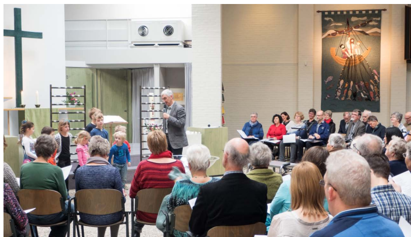
Eerste zondag-viering op 7 februari