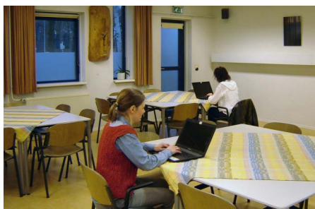
Zaal M van de Ontmoetingskerk

Ben je ZZP'er en zoek je werkruimte met contactmogelijkheden? Wij brengen graag jouw talent met dat van anderen in de wijk in verbinding. Om de behoefte te peilen, loopt er tot 14 juli een pilot. Iedere donderdag kun je terecht. Als je wilt, kun je je dag tussen 9.00 en 11.00 uur beginnen in de meditatiekamer. In zaal M zijn verder van 9.00 tot 15.00 uur tien rustige werkplekken beschikbaar, elk met een eigen tafel (met stroomverbinding) en gratis