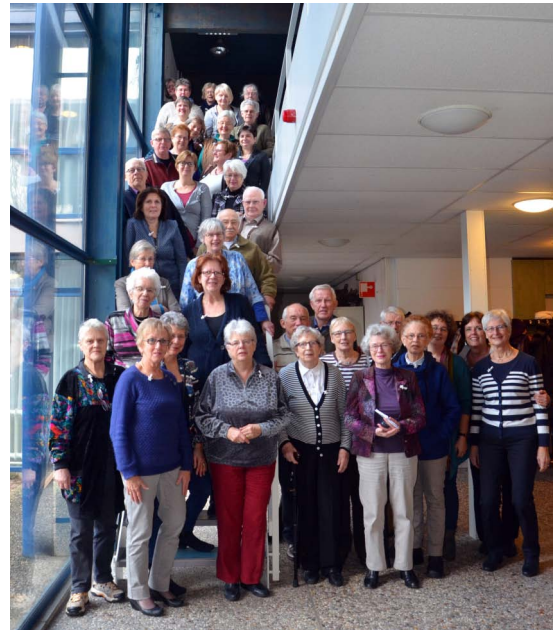
Al onze vrijwilligers doen voor en achter de schermen veel werk. Maar we kunnen niet zonder financiële bijdragen. Mogen we op u rekenen?

Maar al die pakken koffie zijn niet gratis. Net als veel andere zaken en activiteiten die in en door de kerk worden gedaan. Alles moet worden betaald uit giften. We hopen dat we ook in de toekomst een open en gastvrije kerk kunnen blijven. Een kerk die deelt. Daarom veel dank aan allen die al reageerden op onze vraag vanuit de actie Kerkbalans. We zijn blij met ieder die helpt om de koffie - en al die andere rekeningen - te kunnen betalen.