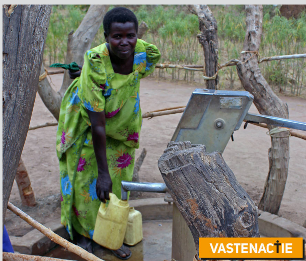
Vrouw bij waterput, Oeganda

Mensen willen niet vluchten, mensen blijven liever waar ze zijn. Als ze vrede hebben, als ze werk hebben, als ze maar water hebben.