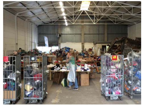
Hal van de Kledingbank

Aanmelden (tot uiterlijk 15 maart) via het formulier in de kerk of via de40dagenmaaltijden@ontmoetingskerk.net .